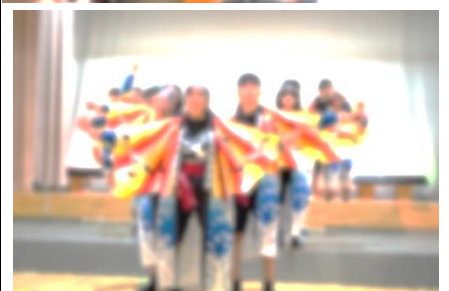
高等部 「一味同心 KO-TO-BU!!」