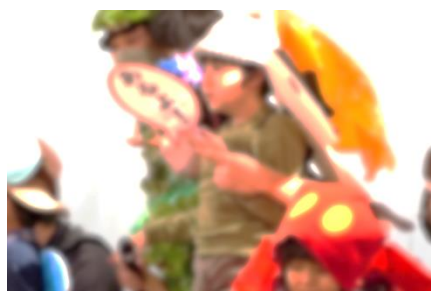
小学部 「ブレーメンの音楽隊」