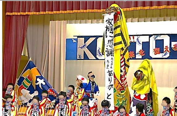
高等部 「前へ!!未来を変える!!KO-TO-BU!!」