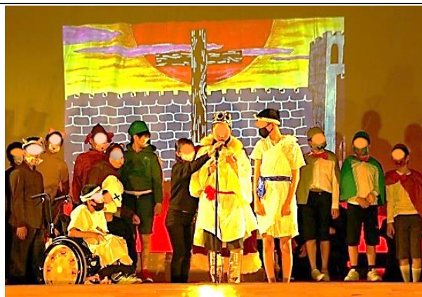
中学部 「小さな三つの物語」