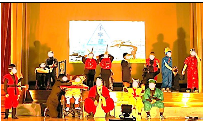
小学部 「さいゆうき」

今回の学校祭は、学部ごと入れ替え制での実施でしたので、他学部の発表を御覧いただけませんでした。各学部の発表の一部ですが、写真で御紹介いたします。